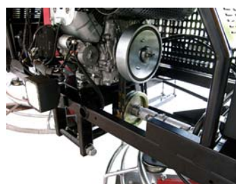
Widok sprzęgła odśrodkowego