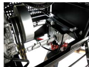
Widok wału Kardana