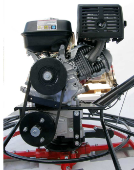
Widok sprzęgła odśrodkowego po zdjęciu osłony