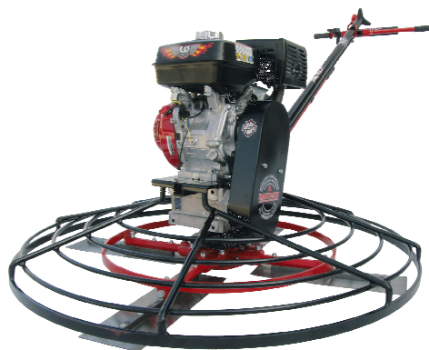
Zacieraczka - widok ogólny